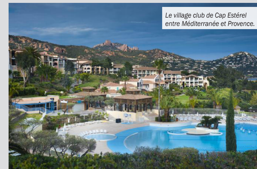
Le village club de Cap Estérel entre Méditerranée et Provence.

Découvrez le monde des aviateurs avec Flying Safari. Baptême de l'air et découverte de la région en ULM. Renseignements au 06.60.05.49.91 ou sur www.ulmflyingsafari.com