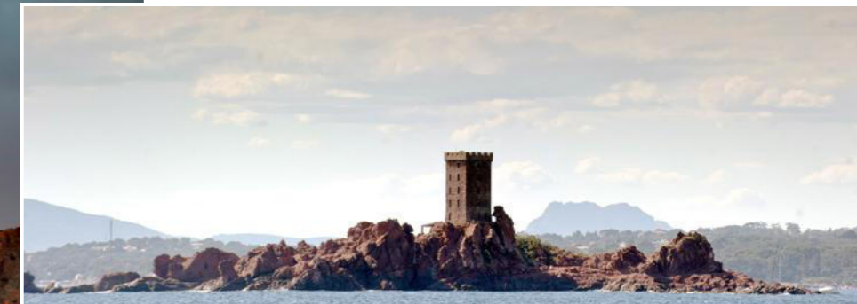
L'île d'Or est surmontée d'une tour à l'allure médiévale dont on dit qu'elle aurait inspiré Hergé pour un album de Tintin.

« Même pour ceux qui ont vu la Suisse et la Savoie, c'est une belle chose que la montagne couverte par les sombres verdure de l'Estérel. Les Alpes meurent ici dignement », écrivait le grand dramaturge Victor Hugo.