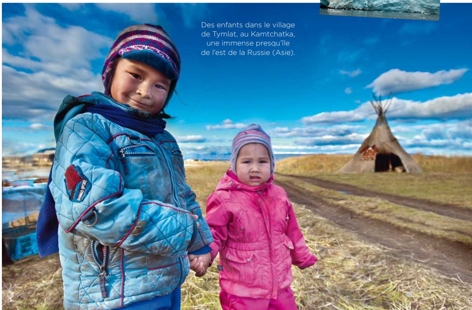
Des enfants dans le village de Tymlat, au Kamtchatka, une immense presqu'île de l'est de la Russie (Asie).