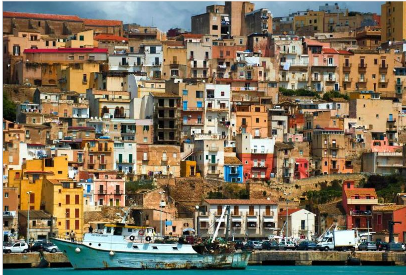
Le port de Sciacca, au sud de la Sicile, symbolise une île aux mille beautés.

Dans le petit port de Sciacca au sud de l'île, un silence presque étrange accompagne l'attente des pêcheurs du large. Alors, un à un, les chalutiers entourés de mouettes et d'oiseaux de mer affament leur retour. Des cris de joie sont lancés par quelques enfants qui rêvent de prendre place un jour dans la flottille. Même les anciens quittent les terrasses des cafés pour venir accueillir les petites embarcations. Tout le monde est là pour emporter au plus vite les poissons, les moules et les crevettes fraîches.