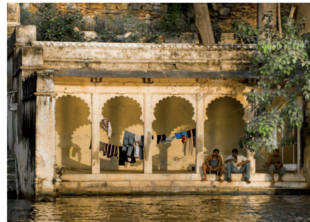
Dans le Rajasthan, Udaipur, la Venise de l'Orient, riche de ses palais qui s'embrasent au soleil couchant sur les rives du lac Pichola.