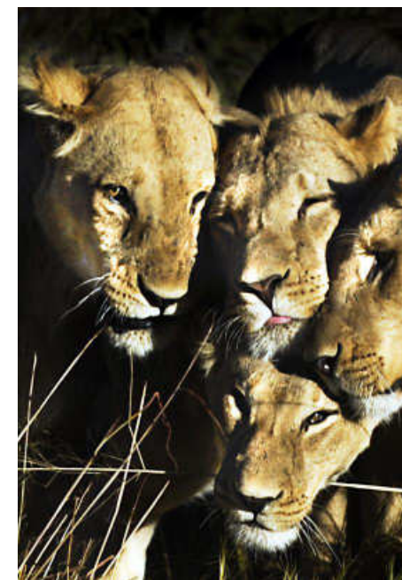
Les lionnes chassent souvent en groupe.

torat britannique du Bechuanaland retrouve alors ses traditions de concertation de l'époque précoloniale. Les Tswanas, qui représentent actuellement la principale composante ethnique du pays, ont toujours favorisé les rencontres citoyennes sous forme de débats publics. Ces assemblées villageoises, appelées Kgotlas, concèdent à chacun le droit de participer aux décisions importantes pour la communauté. Sous le regard avisé du chef de village, cette pratique démocratique permet d'impliquer politiquement tous les individus et de trouver des consensus autour des questions sociales et judiciaires. Ainsi, au cours d'un symposium des nations pacifiques à Washington, le Botswana s'est vu décerner le titre de la nation la plus pacifique d'Afrique sub-saharienne.