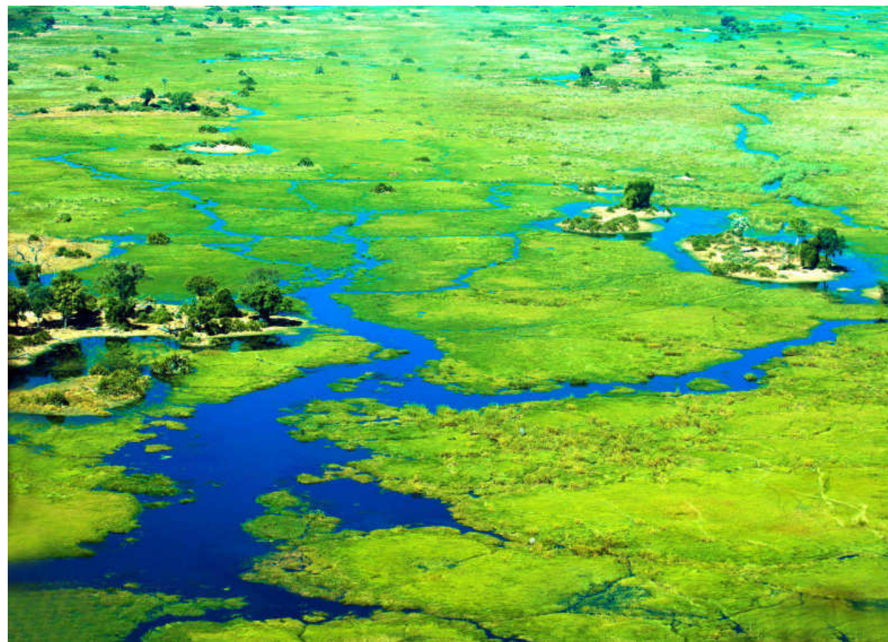
Les vastes plaines du delta de l'Okavango.

À la fin de la saison sèche, les grands troupeaux d'éléphants, de buffles et de zèbres retrouvent les eaux salvatrices du delta.